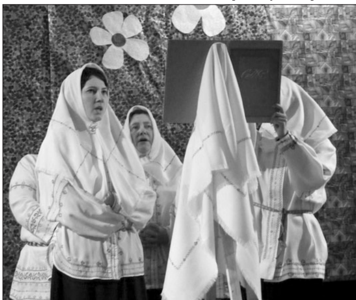
Выступает хор «Грезн»

Перед тем как попроситься, духовную пищу подкрепили сладостями для осужденных и фруктами для детского дома при тюрьме переданными от Рижской Богоявленской Поморской старообрядческой общины. Староверческое общество им. Заволоко подарило тюремной библиотеке свои различные издания в т.ч. газету «Меч духовный». Так же отдельные номера газеты были переданы присутствующим на встрече.