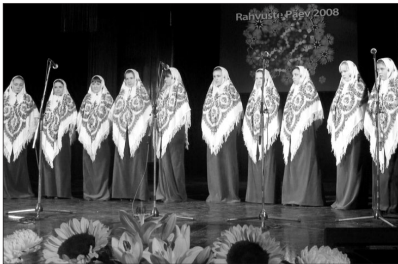
Хор девочек из деревни Кольки на гала-концерте