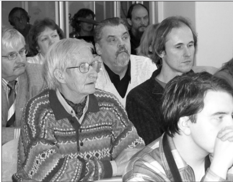
Во время пленарного заседания

Первый день конференции, 2 октября, проходил на кафедре русского языка Тартуского университета. После приветственных речей открытия мероприятия, участники конференции перешли к обсуждению проблем определенных повесткой дня, первая часть которой была отведена общим, информативным вопросам.