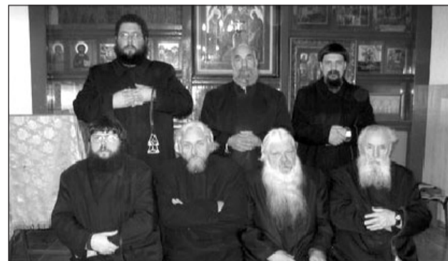
Участники Духовного Суда Древлеправославной Поморской Церкви Литвы

После этого Высший Совет заслушал выступления приглашенных председателей общин, которые рассказали о работе Советов общин, проблемах,