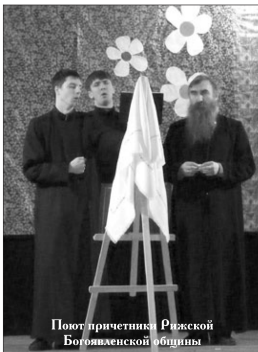
Поют причетники Рижской Богоявленской общины

во им. Заволоко подарило тюремной библиотеке свои различные издания в т.ч. газету «Меч духовный». Так же отдельные номера газеты были переданы присутствующим на встрече.