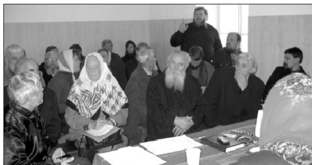
Расширенное заседание Высшего Совета

Первым в повестке дня был вопрос об отчетах ответственных за регионы. Ответственные за регионы рассказали о положении дел в регионах, проблемах, достижениях и трудностях отдельных общин. Затем ВС ДПЦ Литвы рассмотрел вопрос об инвентаризации церковного имущества. Обсуждались вопросы о том, как, в какие сроки и какими методами следует проводить инвентаризацию церковного имущества. ВС ДПЦ признал необходимым скорейшее проведение инвентаризации с тем, чтобы предот-