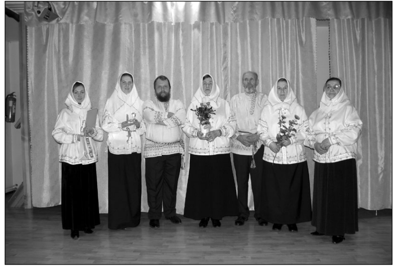
Хор «Грезн» Народном доме поселка Колкья

Исполнители духовных песнопений из Латвии и Эстонии буквально покорили публику, о чем свидетельствовали слова благодарности в Доме Черноголовых и в Народном доме поселка Колкья, откуда родом староверский детский хор. Среди гостей в Таллине были знаменитый композитор Велье Тормис, поэт и министр народонаселения Эстонии в одном лице Пауль-Эрик Руммо, знаменитые эстонские художники Юри Аррак и Николай Кормашов, режиссер-документалист Пеетер Сиим, известная эстонская фольклористка Таллинского