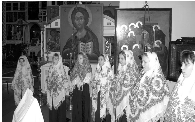
Детский хор в Муственском храме

вел на праздновании 100-летия Храма Святой Троицы в де-