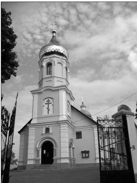
шения свободы вероисповедания и сооружения храмов, трудами Аристарха Моисеевича

Первоначальное здание не имело куполов. Только два креста на крыше указывали на назначение здания. Только после провозгла-