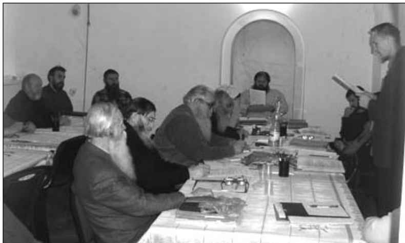
Заседание Предсоборной комиссии ДПЦ

В центре Москвы, рядом со Старой Басманной улицей, в Токмаковом переулке возрождается к жизни уникальный храм — яркий образец северного модерна. Его необычные очертания сразу же привлекают к себе взгляд — оставить равнодушным он не может. Интересен храм еще и тем, что выстроен он старообрядцами-поморцами почти сто лет назад, после того как Николай II издал в 1905 г. указ «Об укреплении начал веротерпимости» — разрешавший старообрядцам строить церкви и молельные. Храм в Токмаковом переулке стал первым храмом этого периода, по праву называемого «золотым веком старообрядчества».