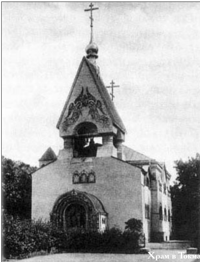
Храм в Токмаковом переулке