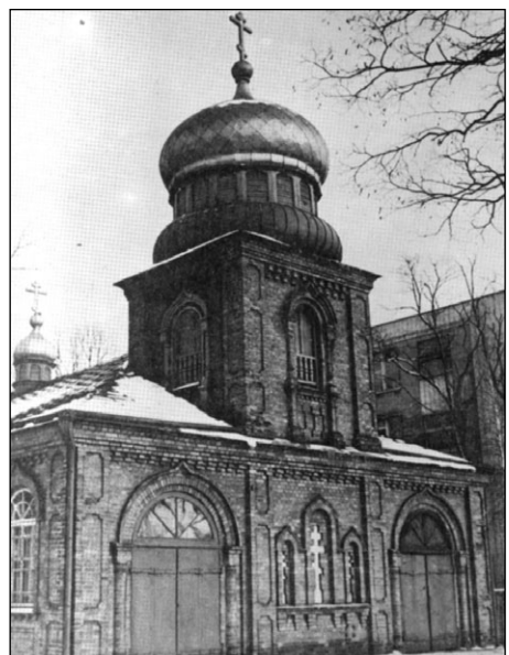
Каунасский старообрядческий храм