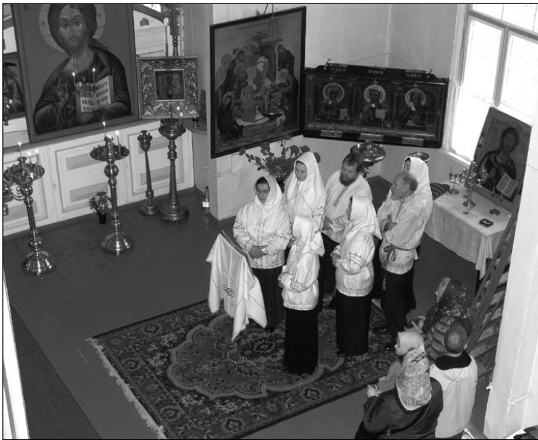
Выступление хора «Грезн» в Муственском храме

вые с духовными стихами детский хор выступил в 2000 году в Муствее на праздновании 70-летия Храма Святой Троицы. Здесь после выступления коллектив получил благословение.