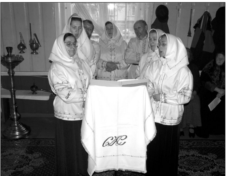
Хор «Грезн» в храме г.Калласте

родном доме поселка Колкья. Нередко среди слушателей были и гости из Норвегии, Шве-