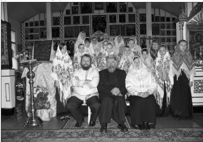
Детский хор и хор «Грезн» после выступления в Муственском храме