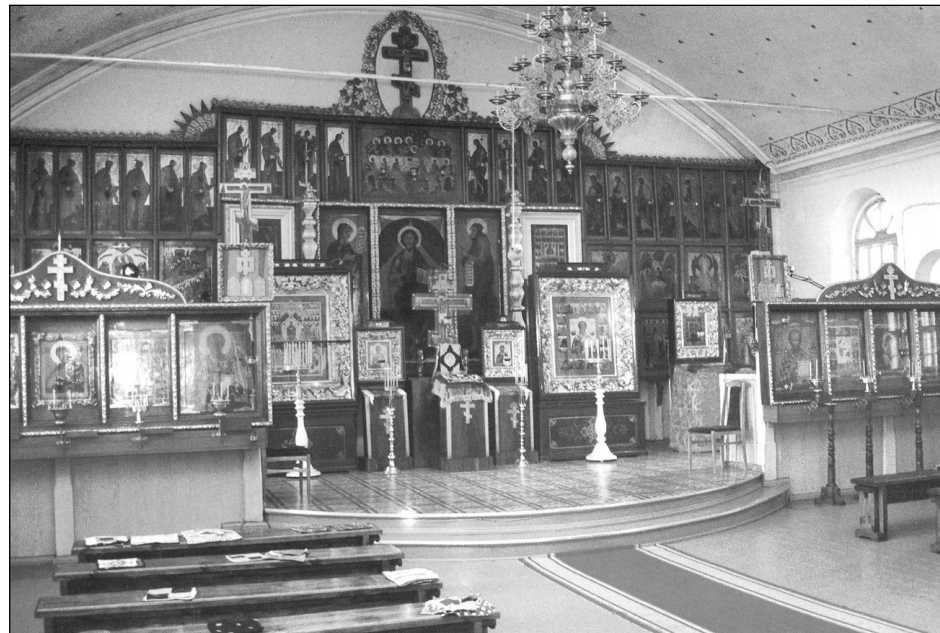
Внутренний вид Каунасского старообрядческого храма