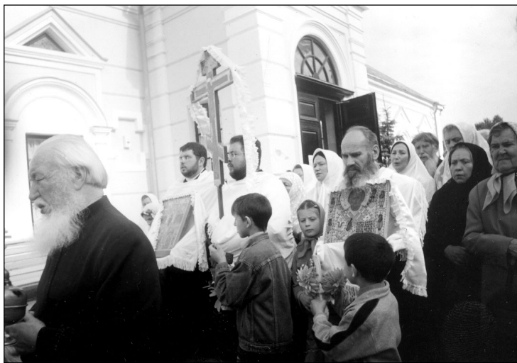
Освящение нового купола 27 сентября 2005 года

Пимонова пристроены в 1905 году к молитвенному дому каменная колокольня с главою и купол над домом. Здание приняло вид храма.